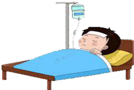
العجز عن استعمال الماء بسبب